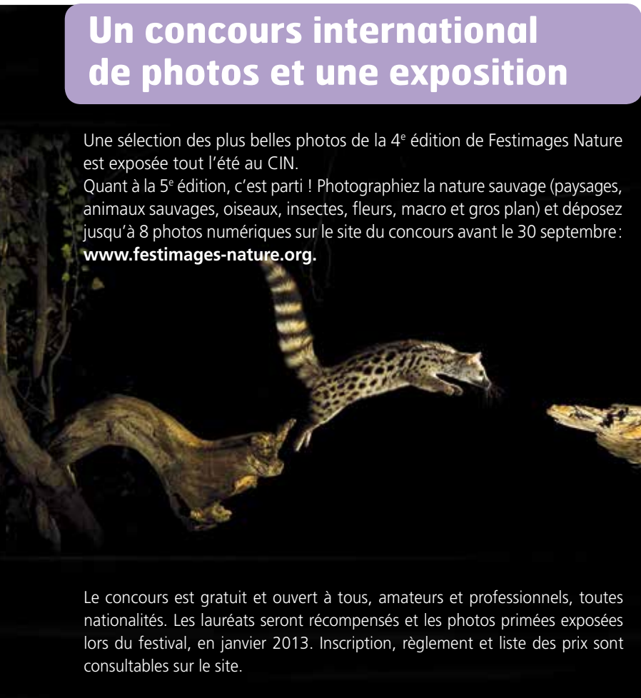
Grand prix du jury Festimages Nature 4 © "Le saut" Jorge Ruiz del Olm

Quant à la 5 e édition, c'est parti ! Photographiez la nature sauvage (paysages, animaux sauvages, oiseaux, insectes, fleurs, macro et gros plan) et déposez jusqu'à 8 photos numériques sur le site du concours avant le 30 septembre : www.festimages-nature.org .