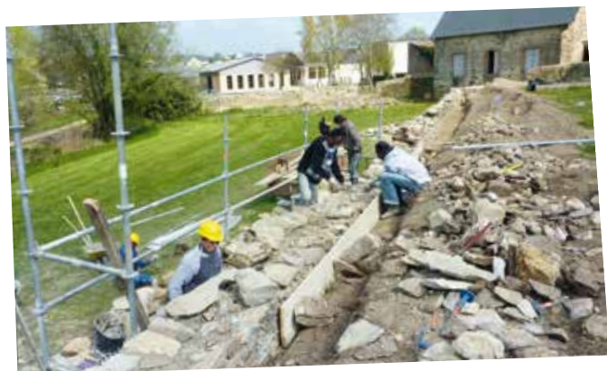
Le chantier, porté par la Maison familiale et rurale des Touches, a été co-financé par Laval Agglo et le Conseil régional.

L'objectif de ce stage de pré-qualification est également d'apprendre (ou de réapprendre) les règles de sécurité, les consignes de travail, le travail en équipe, le rythme et les horaires de l'entreprise : un challenge pour ces stagiaires éloignés de l'emploi, une expérience qui doit les mener vers la qualification professionnelle.