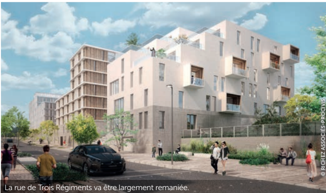
La rue de Trois Régiments va être largement remaniée.

La porte d'entrée sur le territoire de Laval Agglo prend forme à travers un nouveau quartier vivant et attractif. Les premières constructions ont démarré.