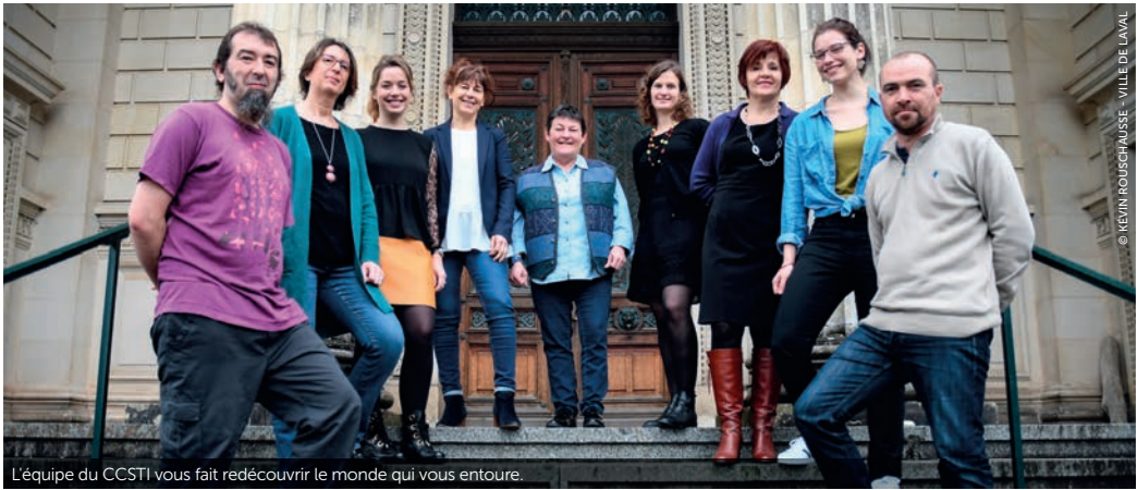
L'équipe du CCSTI vous fait redécouvrir le monde qui vous entoure.