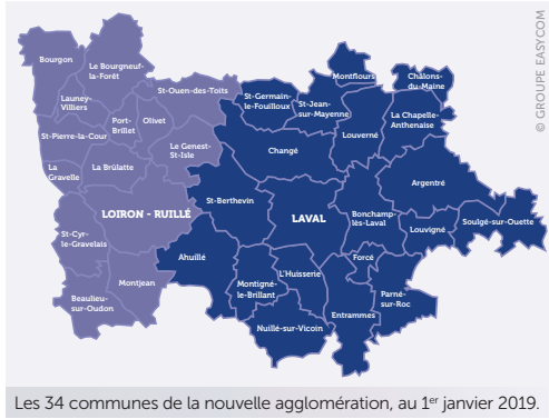
Les 34 communes de la nouvelle agglomération, au 1 er janvier 2019.