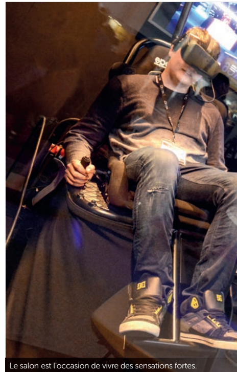
Le salon est l'occasion de vivre des sensations fortes.