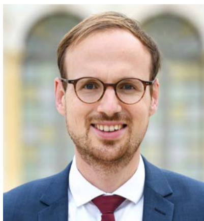
Florian BERCAULT maire de Laval et président de Laval Agglomération