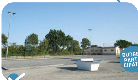
✔ Aménagement d'un terrain de pétanque, d'une table de ping-pong et d'une table de teqball.