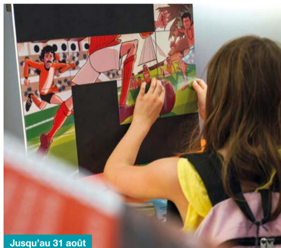
Jusqu'au 31 août