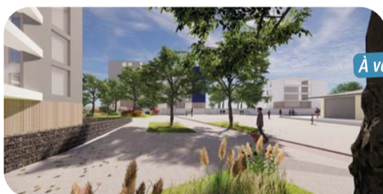
À venir Rénovation de la place de la Commune . Plus agréable et accueillante, la place fera la part belle à la biodiversité et aux espaces de jeux et de rencontre !