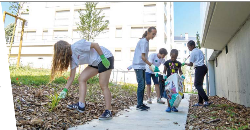
Clean-up challenge, initié par le Conseil des Jeunes, à Saint-Nicolas, en juin dernier.

Dès son arrivée, l'équipe municipale a suggéré la mise en place de plusieurs dispositifs de participation citoyenne. À l'instar du Conseil des Jeunes, de la Commission extra-municipale du Commerce, du Comité de suivi des travaux de la Place du 11-Novembre, ou du Conseil des Piétons. Le Conseil des Sages, créé en 2009, a été totalement renouvelé en 2023, mettant en avant une parité et une diversité de parcours. Des instances participatives au sein desquelles des femmes et des hommes, d'âges et d'horizons divers, planchent sur de nombreux projets en lien avec la solidarité, le commerce, l'accès à la culture, l'amélioration du cadre de vie. Ils participent, par ailleurs, au suivi des grands chantiers qui façonneront le paysage lavallois de demain.