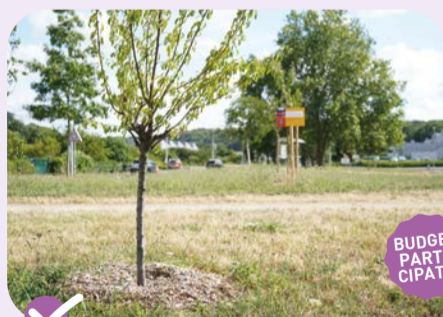
✔ Plantation d'arbres fruitiers (noyer, figuier, cerisier, noisetier...) au Gravier.