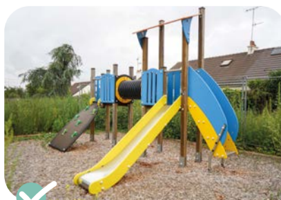
✔ Création d'une aire de jeux pour enfants près de l'école Thévalles.