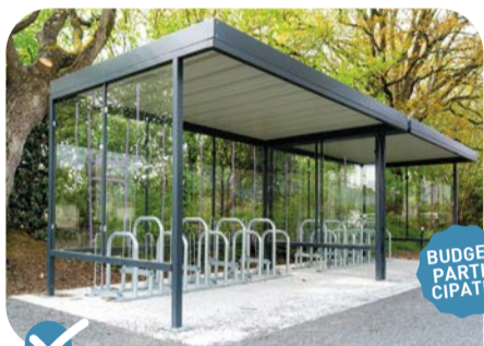
✔ Installation d'un abri-vélos à l'école Saint-Exupéry.

✔ Limitation de vitesse : tout le quartier passe en zone 30 .