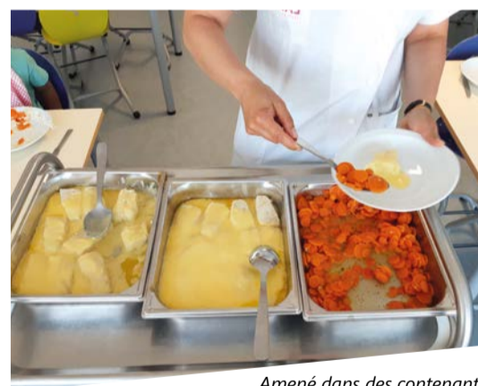
Amené dans des contenants en inox, le repas est plus appétissant.

Il est prévu de poursuivre l'expérimentation dans