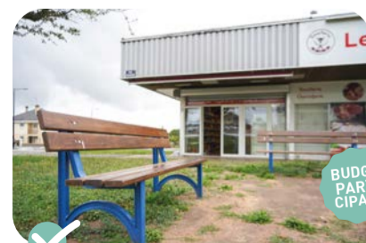
✔ Installation de bancs aux abords de la Maison de quartier Saint-Nicolas, devant les commerces.