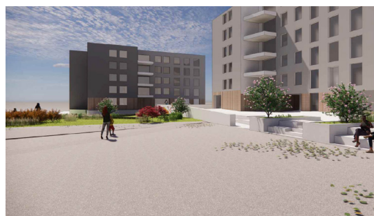
Gradins / amphithéâtre pour les animations