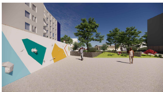
Mur d'escalade ludique