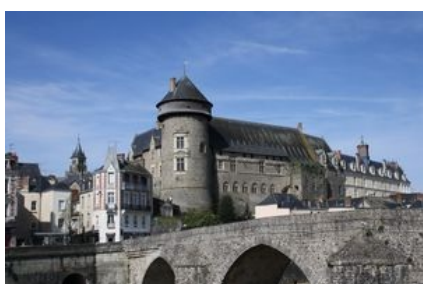
Le château de Laval