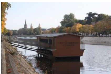
Le bateau-lavoir Saint-Julien