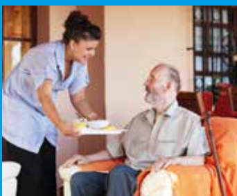
Portage de repas