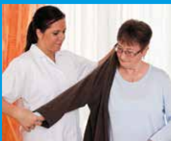
Aide à domicile