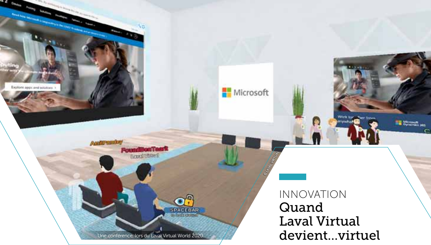
Une conférence, lors du Laval Virtual World 2020.