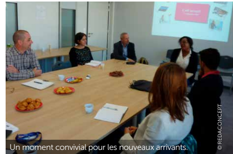
Un moment convivial pour les nouveaux arrivants.