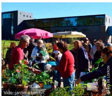
Vide-jardin à Loiron.

D'ici là, les services de Laval Agglo ou du Pays de Loiron, telles que la culture, la Maison de services au Public, l'École de musique, de théâtre et d'arts plastiques ou le Relais Assistants Maternels continueront de fonctionner de la même manière afin d'assurer une continuité de service et de proximité au quotidien.