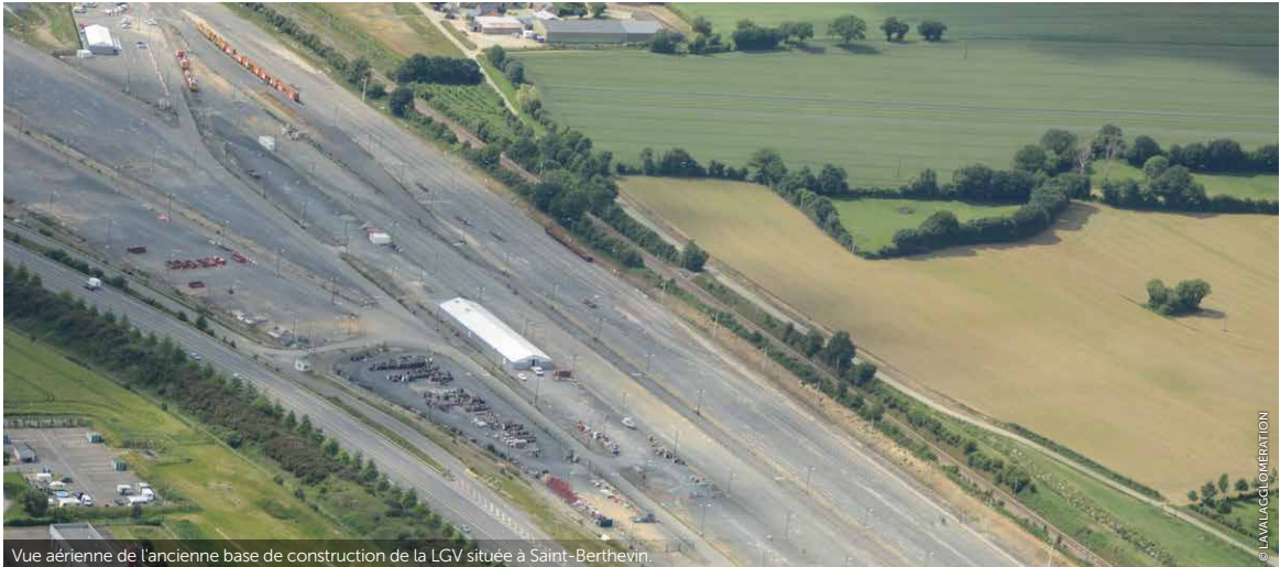
Vue aérienne de l'ancienne base de construction de la LGV située à Saint-Berthevin.