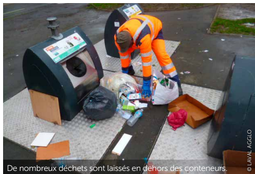
De nombreux déchets sont laissés en dehors des conteneurs.

De trop nombreuses incivilités sont encore observées en matière de dépôts sauvages de déchets et d'encombrants à proximité des conteneurs aériens ou enterrés dans l'agglomération. Les points d'apport volontaire ne sont pas des déchetteries ! Outre l'impact environnemental, les dépôts sauvages génèrent une pollution visuelle et olfactive, attirent les nuisibles, et présentent un danger pour la santé, en particulier lorsqu'il s'agit de produits toxiques laissés à ciel ouvert. Ces dépôts sont strictement interdits par la loi : le risque pénal encouru peut aller jusqu'à une amende de 1 500€ , comme le rappelle un affichage récent sur les points d'apport volontaire. Désormais, tous ces sites sont surveillés.