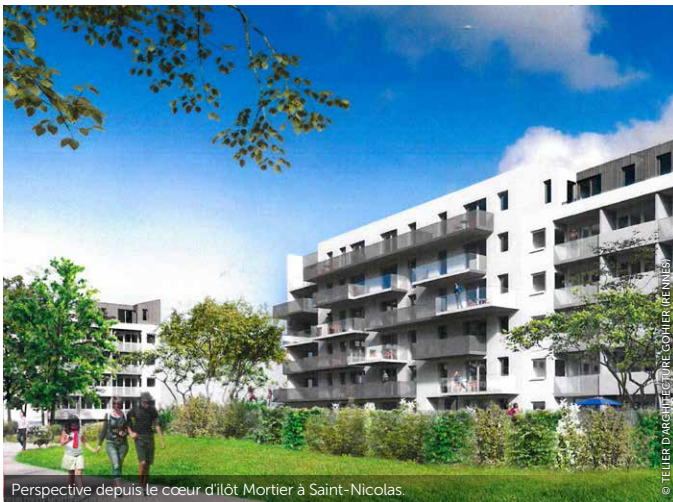
Perspective depuis le cœur d'îlot Mortier à Saint-Nicolas.

Un projet ambitieux de rénovation urbaine, porté par le Contrat de ville, doit permettre, d'ici 2024, de réaménager ce grand quartier.