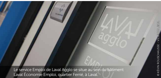
Le service Emploi de Laval Agglo se situe au sein du bâtiment Laval Économie Emploi, quartier Ferrié, à Laval.